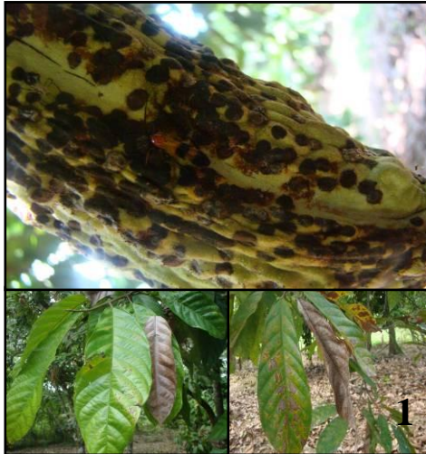
Figura 3. Sintomatología más común encontrada en la Provincia de Los Ríos: Aparición de pintas en las mazorcas que cubren la superficie, en la parte inferior de la figura 3 se observan, manchas en hojas acompañadas de una clorosis foliar.

comprendían el 15% del follaje ocasionados por un defoliador que, debido a las condiciones climáticas de la zona (alto grado de humedad) propició el crecimiento de líquenes en los troncos, la aparición de basidiocarpos de Moniliophthora perniciosa y la sintomatología característica de la enfermedad de escoba bruja en mazorcas.