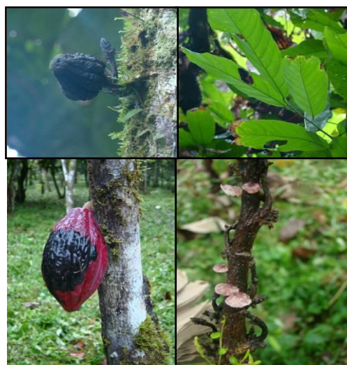
Figura 2. Sintomatología encontrada en la provincia del Guayas: se destacan daños en hojas que