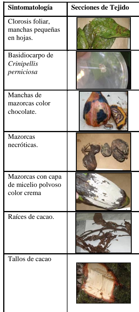
Tabla 1. Descripción de la sintomatología más relevante encontrada en las diferentes zonas

En la Tabla 1 se presentan más detalladamente los síntomas más relevantes encontrados.