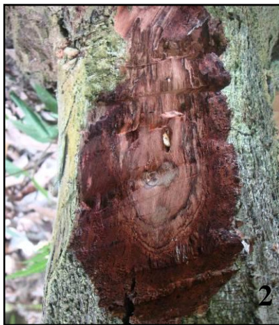
Figura 4. Secciones negruzcas en los tallos ocasionaban la marchitez en hojas y ramas hasta la muerte posterior del árbol.

En la Tabla 1 se presentan más detalladamente los síntomas más relevantes encontrados.