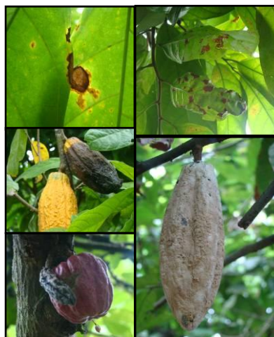
Figura 1. Sintomatología encontrada en sectores de la Provincia de El Oro. En la parte superior se destacan las afecciones en hojas encontradas en un 20% de las plantaciones inspeccionadas. En la parte inferior la diversidad de sintomatologías observadas en mazorcas como: mancha chocolate que se va extendiendo por toda la superficie, mazorcas con una capa pulverulenta de color crema y mazorcas con un crecimiento atrofiado.

Los síntomas en mazorcas fueron los más frecuentemente encontrados, los daños ocasionados que mostraban pintas en mazorcas sólo se presentaron en las zonas de la provincia del Guayas, mientras que daños en hojas fueron más comunes en las provincias de Los Ríos y Guayas. Las Figuras 1, 2, 3 muestran algunos de los síntomas más comunes encontrados en plantaciones de cacao nacional en áreas de la costa ecuatoriana.