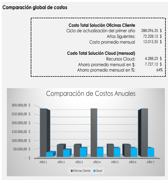
Fig. 2 Comparación de los costos anuales

Finalmente, en la Fig. 3 se observa que el ahorro de la solución a tres años es de un 73% entre la solución Cloud vs modelo tradicional.